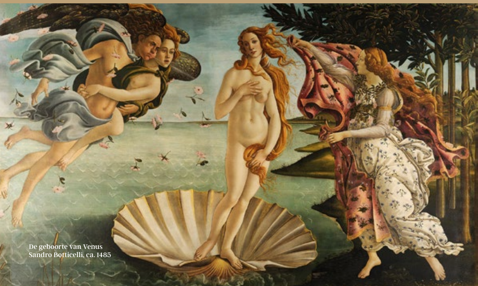
De geboorte van Venus Sandro Botticelli, ca. 1485