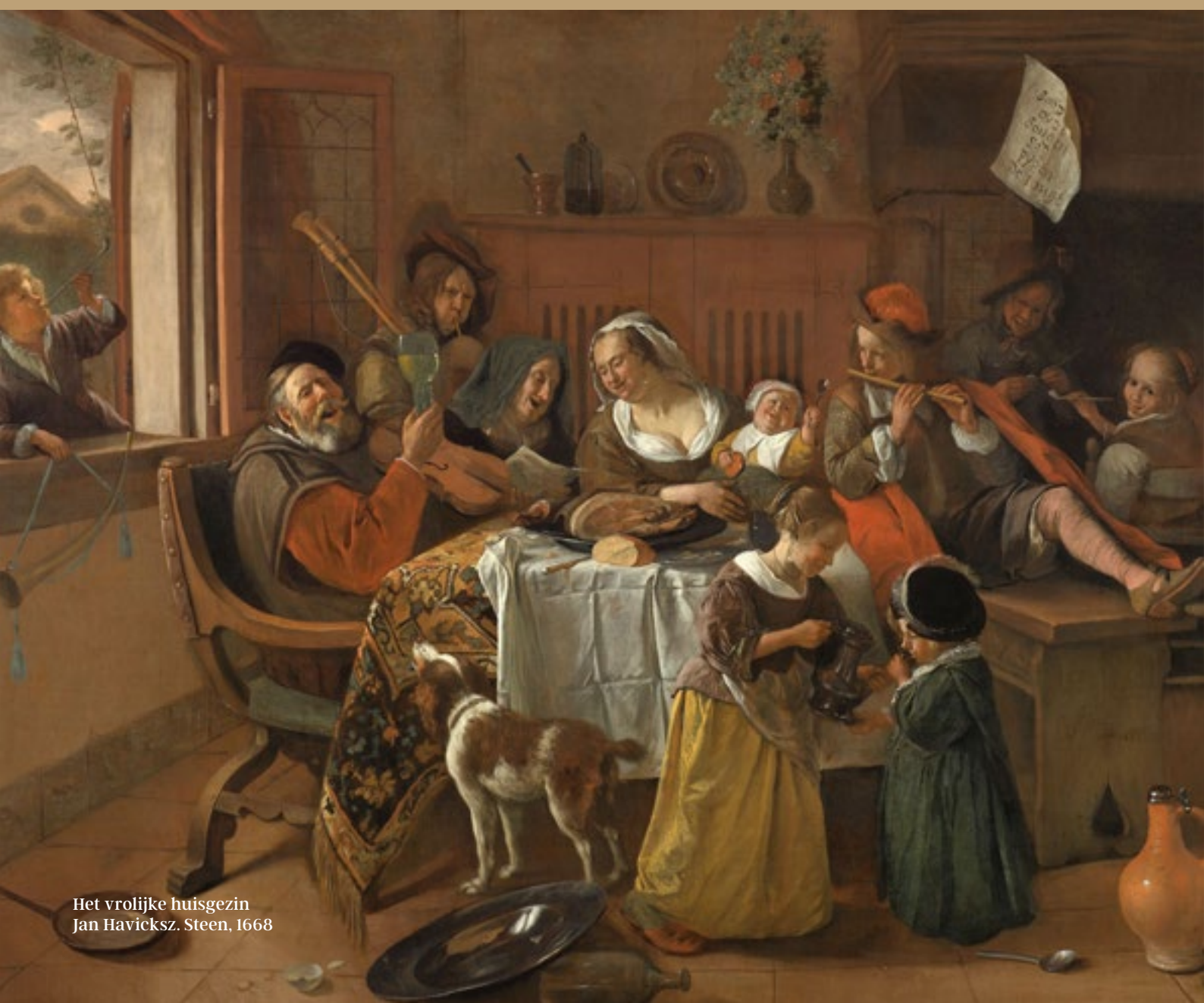
Het vrolijke huisgezin Jan Havicksz. Steen, 1668